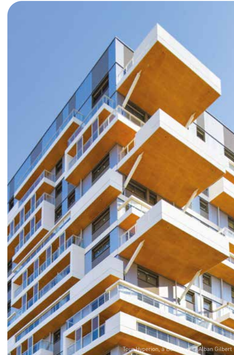
Tour Hyperion, à Bordeaux © Alban Gilbert